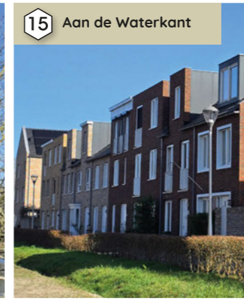
15 Aan de Waterkant