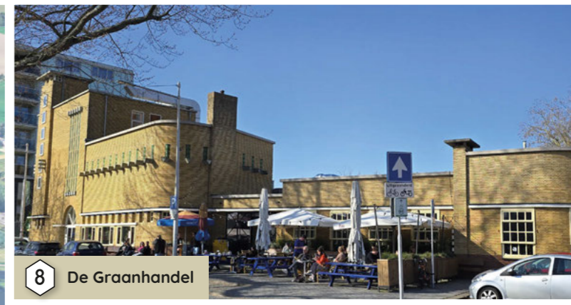
8 De Graanhandel