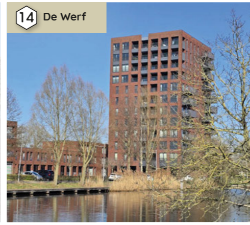
14 De Werf