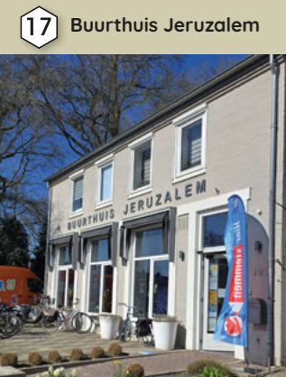
17 Buurthuis Jeruzalem