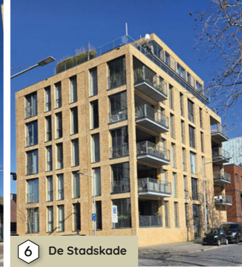
6 De Stadskade