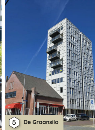
5 De Graansilo