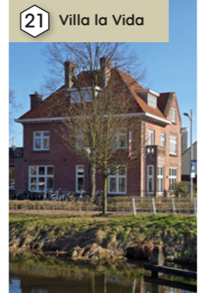
21 Villa la Vida