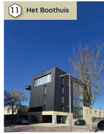
11 Het Boothuis