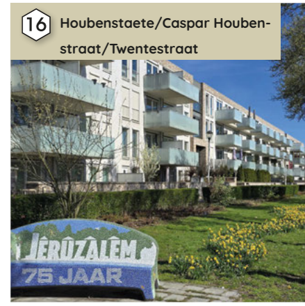
16 Houbenstaete/Caspar Houbenstraat/Twentestraat