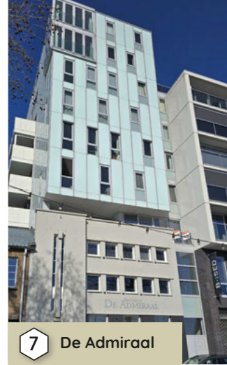
7 De Admiraal