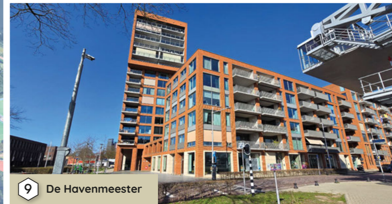
9 De Havenmeester