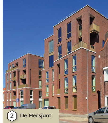
2 De Mersjant