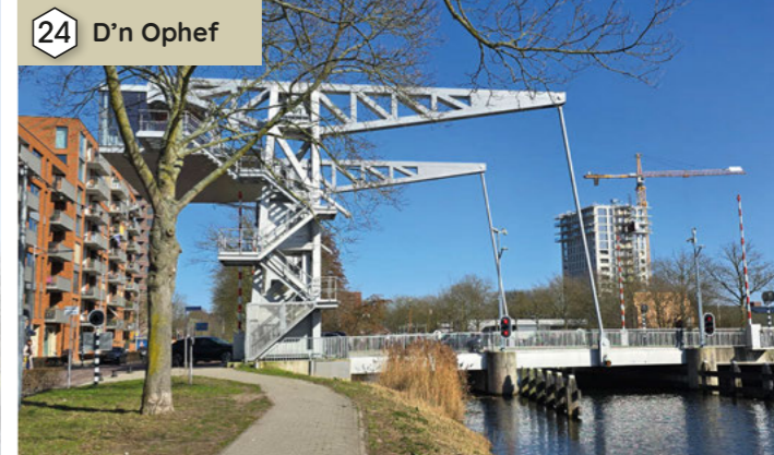
24 D'n Ophef