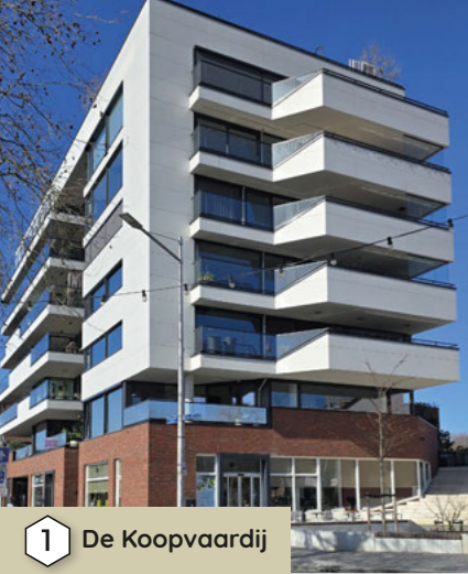
1 De Koopvaardij